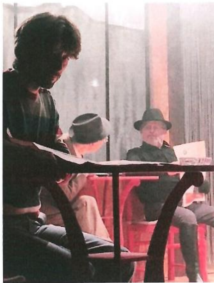
A Casazza. Un momento delle prove di «Al Sichiatra»

con libero adattamento di Giacomo Andrico, che cura la regia dello spettacolo prossimo al debutto nel teatro parrocchiale di Casazza, avvalendosi della collaborazione di Valerio Del Giudice, assistente alla regia. La divertente commedia dei primi del Novecento, un classico del teatro napoletano, trova ambientazione negli anni '50-'60, nella trasposizione bresciana tra la Bassa e la città. Per il pubblico «nostro» degli anni Duemila, spiega il regista, l'inedito allestimento ha richiesto «un lavoro di sintesi, un'asciugatura di tante situazioni. Bisogna tener conto della forza della recitazione in quel contesto, mentre il nostro dialetto è più immediato e